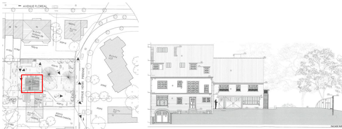
Plan d'implantation avec en rouge la nouvelle annexe ; élévation projeté (à droite la nouvelle annexe) – documents extraits du dossier de demande.

Le dossier comporte un rapport d'expertise des 3 arbres remarquables mentionnés ci-dessus. Cette expertise a été réalisée à l'initiative du demandeur en vue d'adapter son projet (initialement plus important) de manière à ce que celui-ci garantisse la préservation des trois arbres remarquables. La demande actuelle intègre la plupart des recommandations qui ont été formulées dans ce rapport et la construction de l'annexe ne devrait dès lors pas porter atteinte aux arbres.