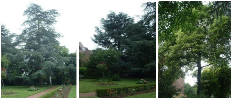
Localisation des 3 arbres remarquables - de gauche à droite : n°5178 (cèdre bleu de l'Atlas), n°5177 (cèdre bleu de l'Atlas) et n°5180 (érable sycomore panaché)

Les principales interventions prévues par le projet sont :