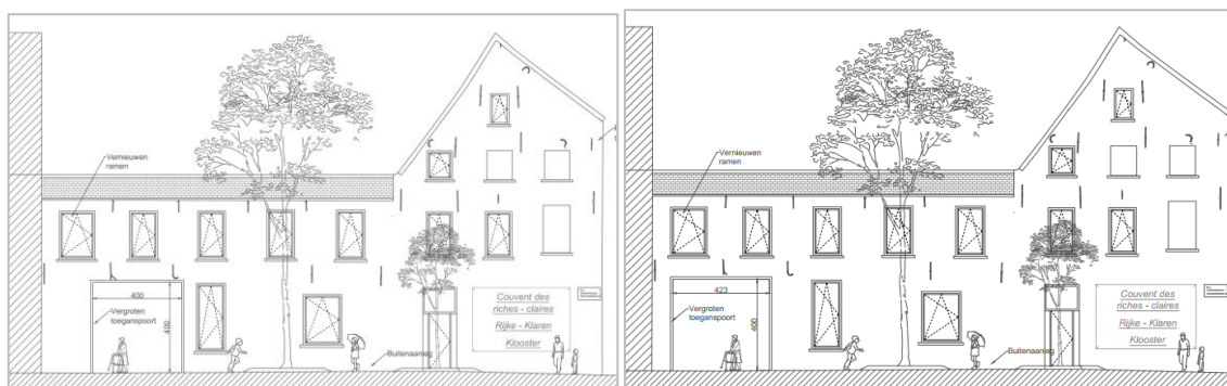
Situation proposée, variante 1 et 2 jointes à la demande

La CRMS rend un avis de principe favorable sur l'élargissement du passage qui, outre les avantages d'ordre fonctionnel, présente une opportunité pour améliorer l'interface des futures affectations avec l'espace public. Comme attesté par les relevés archéologiques joints au dossier, l'élargissement de la baie n'entraîne sur le plan matériel pas de modifications importantes ou inutilement destructrices des maçonneries anciennes.