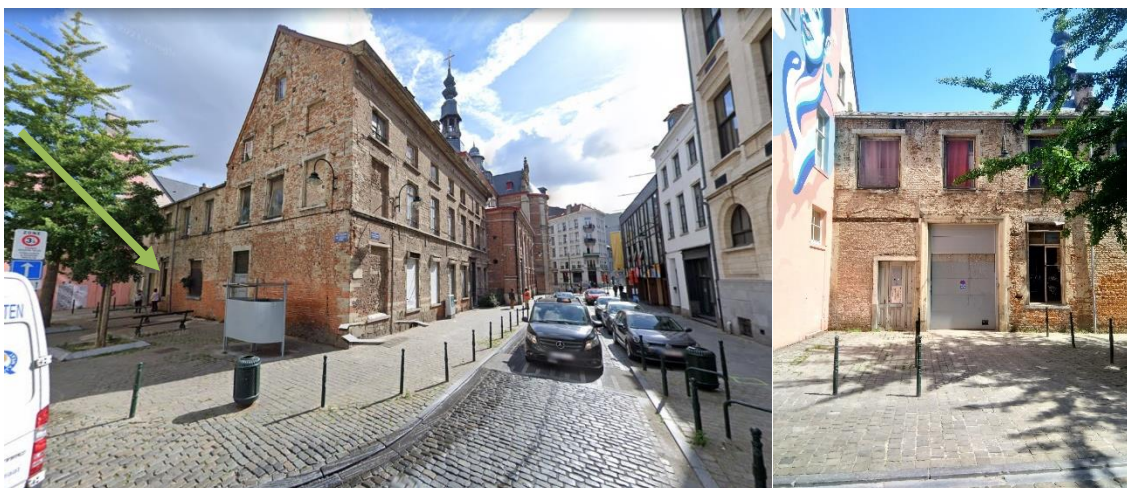
Façade du Couvent des Riches-Claies donnant sur la rue St-Christophe

La présente demande d'avis de principe vise l'agrandissement du portail situé rue Saint-Christophe et donnant accès au cloître en vue de mettre le passage en conformité avec la réglementation incendie et de simplifier l'accès et la gestion du futur chantier. Cette opération précède les travaux d'assainissement de l'aile des vicaires attenante à l'église.