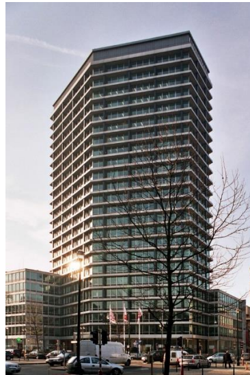
Avant-Projet aquarellé et réalisation finale.