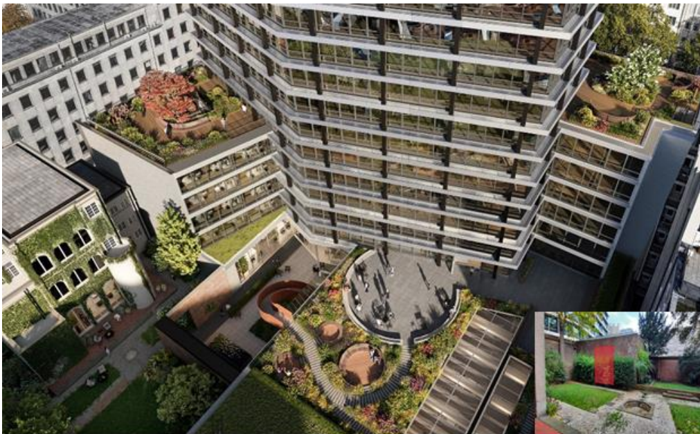
Photomontage tiré de la demande de permis illustrant les aménagements des terrasses-toitures. En bas à droite, le futur percement du mur mitoyen.

Il s'agit d'une demande de modification de permis pour une meilleure exploitation des toitures à l'arrière de la Tour Generali. La demande vise la création de terrasses accessibles sur les toitures arrières des 1 er , 5 ème et 7 ème étages et la pose d'un escalier pour accéder à celle du 1 er depuis les jardins de l'Hôtel Wielemans. Le projet confirme le percement du mur du jardin de l'Hôtel Wielemans, sur lequel la CRMS avait émis un avis de principe favorable sous conditions d'en formuler les modalités pratiques, lors de sa séance du 21/04/2021.