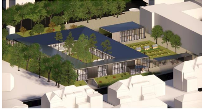
A g. : insertion du complexe scolaire dans le réseau écologique bruxellois et, à dr. : projet de l'école maternelle francophone (extr. du Rapport d'Incidences accompagnant la demande de permis)

Il apparaît aussi que la section maternelle francophone projette également la construction d'un nouveau bâtiment, telle qu'illustré ci-dessus, projet sur lequel la CRMS n'est pas interrogée et qu'elle n'a donc pas analysé. Cependant, il semble de prime abord que ces deux projets offrent des allures et des qualités très diverses. La Commission insiste donc, dans le cadre de la construction durable d'un bâtiment pour les maternelles néerlandophones, sur l'opportunité à saisir d'offrir une architecture harmonieusement intégrée aux abords et valorisante pour le site de l'école.