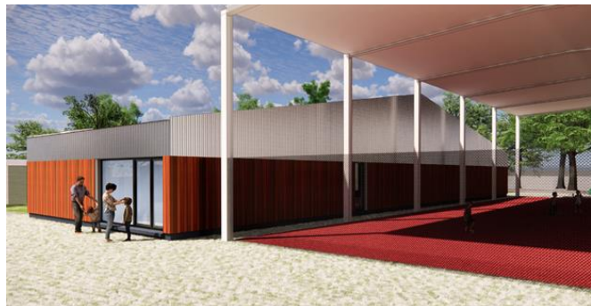
Vue projetée du nouveau bâtiment (extr. du dossier de demande)