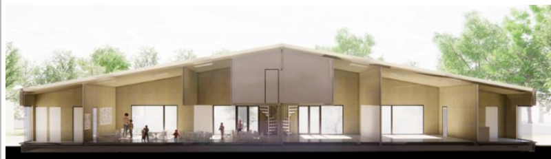
Implantation et vue projetées du nouveau bâtiment (extr. du dossier de demande)