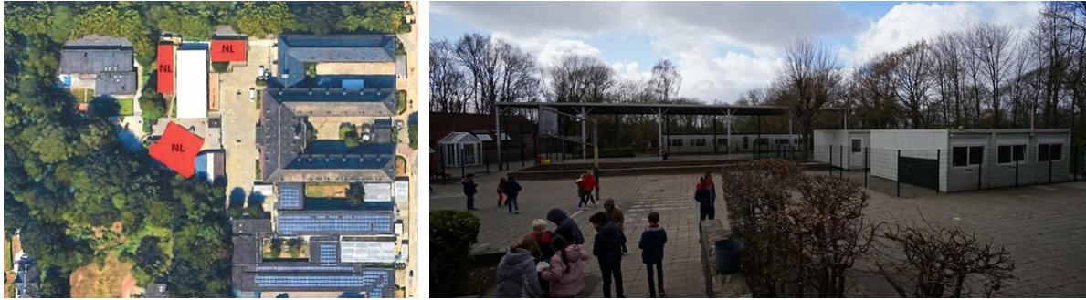
Les bâtiments de la section des maternelles néerlandophones entourant le préau (extr. du dossier de demande)