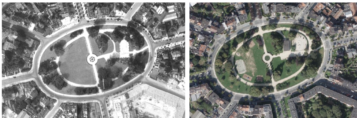
Vue du square en 1953 et vue récente

Situé au centre d'un quartier en étoile créé par AR du 18.02.1899, entre le boulevard de Smet de Naeyer, le boulevard Émile Bockstael et la ligne de chemin de fer de ceinture ouest, ce square ovale est conçu en 1902 par l'ingénieur Jules Zone. Il est baptisé en l'honneur du futur roi Léopold III. S'implantant sur le tracé du Molenbeek qui fit l'objet de travaux de voutement entre 1904 et 1907, il accueillait en son centre un vaste bassin de retenue pour les eaux du ruisseau. Le bassin fut remblayé entre 1927 et 1930.