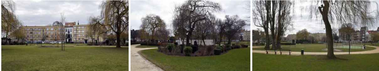
Vues diverses du square

Le square est réaménagé en 1952, sur les plans de René Pechère, alors directeur du Service des Jardins de la Ville de Bruxelles. Outre un chemin périphérique, en bordure duquel quelques arbres sont conservés, le square est doté d'une allée centrale établie dans l'axe des rues Jean Heymans et Émile Delva, bordée par des ifs d'Irlande et ponctuée d'un rond-point, dont les parterres seront remplacés en 1981 par une fontaine à bassin circulaire. En 1967 est implanté, dans la moitié est du square, un pavillon pour jardiniers et pensionnés, pour lequel un avant-projet est conçu en 1964 par l'architecte de la Ville, Jean Rombaux. Les massifs d'arbres, généralement situés en pourtour du square, recèlent de nombreux arbres remarquables comme plusieurs pins, marronniers et érables. De très beaux exemplaires de saules pleureurs, une allée d'ifs, de larges pelouses, des buissons décoratifs complètent harmonieusement cet ensemble.