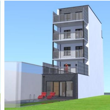
Axonométrie de la façade arrière projetée

Illustrations extraites du dossier de demande