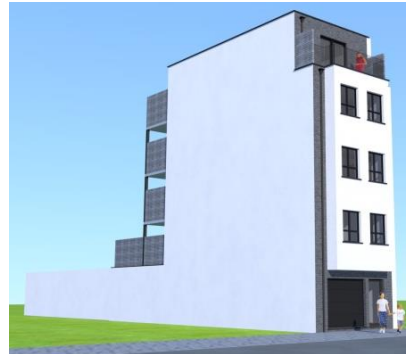
Axonométrie de la façade avant projetée