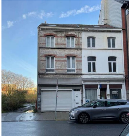
Vue actuelle du bien. Image extraite du dossier.