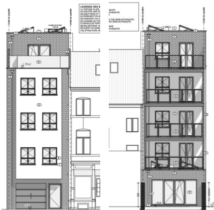
Elévation de la façade avant projetée