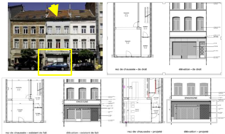
Plans et élévations des situations de droit, existante et projetée, joints à la demande

La demande concerne le changement d'utilisation du rez-de-chaussée commercial et la transformation de la devanture de la maison bourgeoise située 28, place Fernand Cocq. Celle-ci appartient à un ensemble de trois biens de la même typologie, réalisés après la modification en 1860 de l'alignement du côté pair de la place. Compris dans la zone de protection de l'hôtel communal et inscrit à l'Inventaire du patrimoine architectural , l'ensemble s'inscrit aux fronts bâtis homogènes de style néoclassique qui cadrent le monument classé.