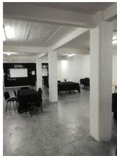
Vue en 2019 - plan actuel du 1 er étage – vue de la salle concernée par la demande

La demande de régulariser le changement d'affectation de l'entrepôt à l'étage en salle polyvalente n'appelle pas de remarques de la CRMS, ce projet n'ayant pas d'impact patrimonial sur la maison communale classée, ni sur la façade avant de la maison, qui reste inchangée.