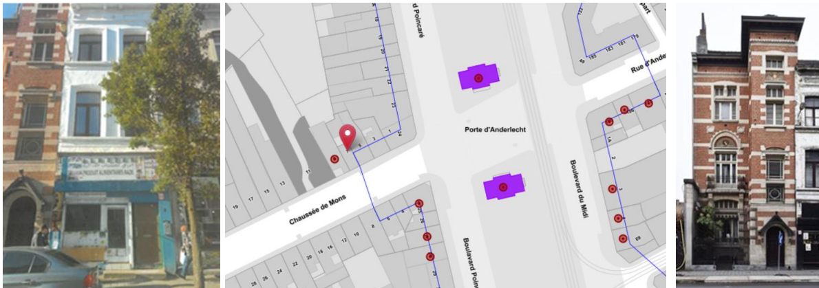
Le bien concerné par la demande, sa position par rapport aux pavillons d'octroi et le n°9 voisin (extr. du dossier de demande, ©Brugis et ©Urban.brussels)

Cette maison néoclassique est reprise de facto à l'Inventaire du patrimoine architectural de la Région de Bruxelles-capitale. De plus, elle jouxte la zone de protection des pavillons d'octroi de la porte d'Anderlecht et est voisine d'une belle maison bourgeoise de style éclectique (n°9, chaussée de Mons).