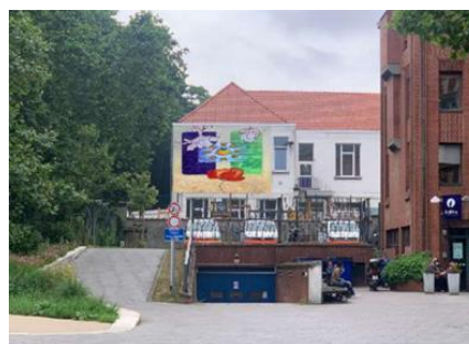
Façade concernée par la demande et photomontage du projet – images extr. du dossier de demande