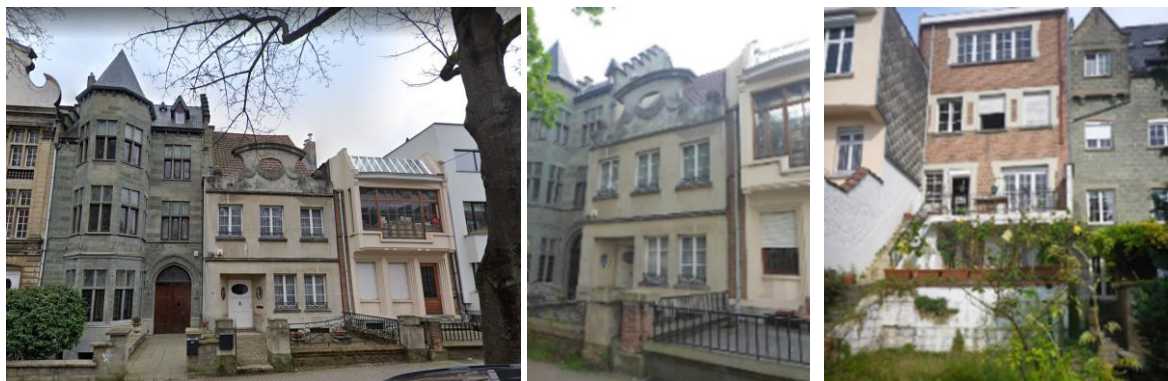
Vue des n°s 189, 187 et 185 (maison Evaldre) (©Google maps), vue des façades avant et arrière (extr. du dossier de demande)

L'immeuble se situe dans la zone de protection de la maison et atelier du maître-verrier et peintre-decorateur Raphaël Evaldre, sise au n°185, en cours de classement comme monument en totalité.