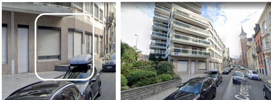
Façade concernée par la demande