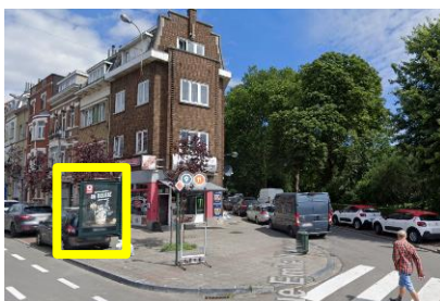
Enseigne sise Av. De Strooper – angle Rue Wauters