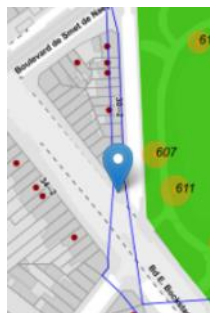
Enseigne sise Av. De Strooper – angle Rue Wauters