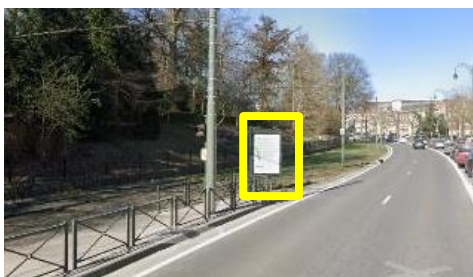
Enseigne sise Av. des Croix de Feu - angle Araucaria