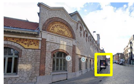
Enseigne sise Rue Dieudonné Lefevre, 51