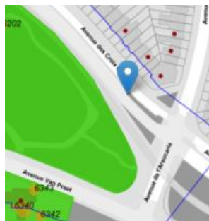
Enseigne sise Av. des Croix de Feu - angle Araucaria

Trois des enseignes de la présente demande sont comprises dans des zones de protection : l'enseigne Av. des Croix de Feu - angle Araucaria est comprise dans la zone de protection des jardins du Pavillon Chinois (classé par AG du 12/06/1997) ; l'enseigne sise Av. De Strooper – angle Rue Wauters est comprise dans la ZP du Square Clémentine (classé par AG du 12/06/1997) ; l'enseigne sise Rue Dieudonné Lefevre, 51 est située dans la zone de protection des anciens établissements Byrrh (classé par AG du 22/05/1997)