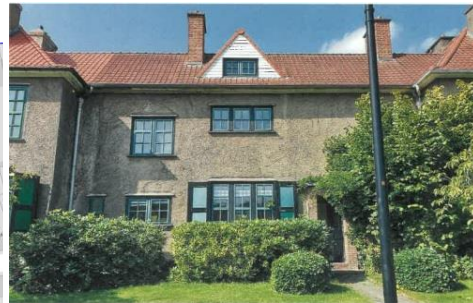
A gauche, extrait Brugsis. A droite, vue de la façade avant (extrait du dossier)

La demande concerne une maison construite suivant les plans de l'architecte J-J Eggericx de 1922-23 et faisant partie de la cité-jardin Le Logis-Floréal, classée comme ensemble (à savoir les zones de recul, les jardins, les venelles, les squares et les places publiques ainsi que les façades et toitures du bâti d'avant 1940).