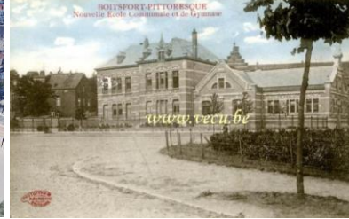
Intégration paysagère de l'îlot de l'Académie