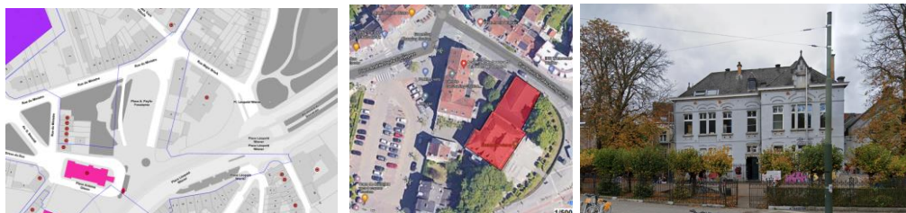
Implantation du bâtiment concernée et façade principale

La demande vise l'isolation et le remplacement de la couverture des toitures du bâtiment de l'Académie des Beaux-Arts de Watermael-Boitsfort donnant sur la place Léopold Wiener et la rue du Major Brück. Le bâtiment est inscrit à l'Inventaire du patrimoine architectural .