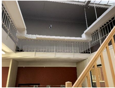
Vue actuelle (photo CRMS, juin 2022)

En ce qui concerne l'ancienne salle de conférences/cours et la mezzanine qui la surplombe, la CRMS estime que la description jointe à la demande introduite par la Ville est à nuancer et ne correspond pas exactement à la situation visible actuellement dans le bâtiment. En effet, la salle de conférences se situe en réalité au premier étage du bâtiment, au-dessus du rez commercial et non pas au rez-de-chaussée. L'ancienne salle de conférences/de cours a subi plusieurs transformations (dont un percement de forme carrée surplombant le commerce du rez). L'escalier initial d'accès à la salle depuis l'entrée cochère n'existe plus. Un escalier récent en bois permet seul l'accès à la mezzanine mais ne correspond pas à son accès initial. Le sol d'origine n'est plus perceptible et présente des décalages ainsi que des revêtements postérieurs. L'encadrement de la baie rectangulaire délimiterait encore l'espace autrefois dévolu aux conférenciers. Un local moderne entouré de cloisons légères a été aménagé dans le fond de la salle.