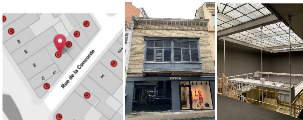
A gauche, extrait Brugis. Au centre et à droite, situation actuelle de la façade et de l'ancienne salle de conférences avec sa mezzanine (photos DPC-URBAN, juin 2022)

La demande initiée par la Ville de Bruxelles porte sur le classement comme monument de l'ancien siège de l'Université Nouvelle de Bruxelles et de l'Institut des Hautes Etudes, principalement pour son intérêt historique. L'immeuble est inscrit à l'inventaire du patrimoine architectural de la Région de Bruxelles-Capitale. 1 L'Université Nouvelle de Bruxelles est issue d'un schisme avec l'ULB incarnant un projet novateur et progressiste qui, entre 1894 et 1919, tient un rôle important dans le paysage scientifique et éducationnel du pays, véritable laboratoire des nouvelles méthodes d'enseignement, accueillant dans ses locaux des intellectuels venus de toute l'Europe. C'est à la demande de l'Université Nouvelle de Bruxelles que ce petit bâtiment de style éclectique est édifié par l'architecte William Defontaine en 1908, en lieu et place des anciennes écuries du 90 avenue Louise, construit par Janlet en 1870.