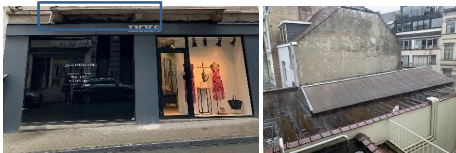
A gauche, la vitrine actuelle avec la trace visible du linteau métallique de l'ancienne porte cochère. A droite, la toiture avec son lanterneau (photos DPC-URBAN, juin 2022)

De style éclectique, la façade est parée de briques blanches scandées par des bandeaux de pierre blanche. Elle se distingue principalement par sa logette en bois qui occupe presque toute la largeur du bel-étage. La corniche en bois repose sur des aisseliers étirés. Le rez-de-chaussée a été transformé en devanture commerciale dès 1977 qui a fait disparaître l'entrée cochère et les deux baies latérales. La nouvelle porte du commerce actuel ne correspond pas à l'entrée historique mais à la baie de fenêtre à droite de cette entrée initiale, agrandie jusqu'au niveau du trottoir. L'immeuble présente une toiture plate (couverte d'une membrane d'étanchéité de type « derbigum », de couleur noire) au centre de laquelle se développe un grand lanterneau rectangulaire surmonté de tôles ondulées en amiante montées en triangle.