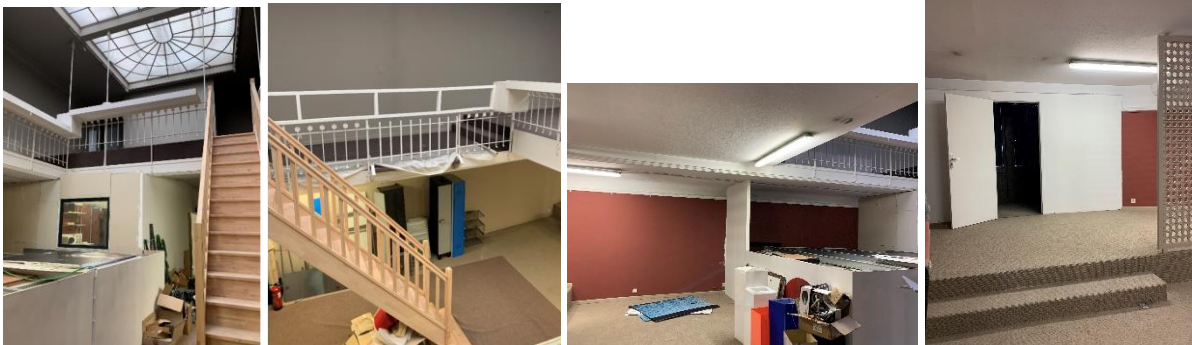
Vues actuelles (photos CRMS, juin 2022)

En ce qui concerne l'ancienne salle de conférences/cours et la mezzanine qui la surplombe, la CRMS estime que la description jointe à la demande introduite par la Ville est à nuancer et ne correspond pas exactement à la situation visible actuellement dans le bâtiment. En effet, la salle de conférences se situe en réalité au premier étage du bâtiment, au-dessus du rez commercial et non pas au rez-de-chaussée. L'ancienne salle de conférences/de cours a subi plusieurs transformations (dont un percement de forme carrée surplombant le commerce du rez). L'escalier initial d'accès à la salle depuis l'entrée cochère n'existe plus. Un escalier récent en bois permet seul l'accès à la mezzanine mais ne correspond pas à son accès initial. Le sol d'origine n'est plus perceptible et présente des décalages ainsi que des revêtements postérieurs. L'encadrement de la baie rectangulaire délimiterait encore l'espace autrefois dévolu aux conférenciers. Un local moderne entouré de cloisons légères a été aménagé dans le fond de la salle.