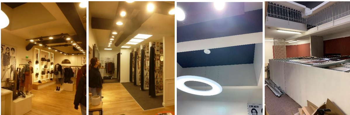
A gauche, vues du rez-de-chaussée commercial. A droite, vue du percement carré dans le plafond du rez-de-chaussée et vue du caisson dans l'ancienne salle de conférences à l'étage (photos CRMS, juin 2022)

La visite sur place a permis de se rendre compte que le rez-de-chaussée de l'immeuble, entièrement occupé par un commerce de vêtements, a été profondément remanié : disparition du hall d'entrée et de