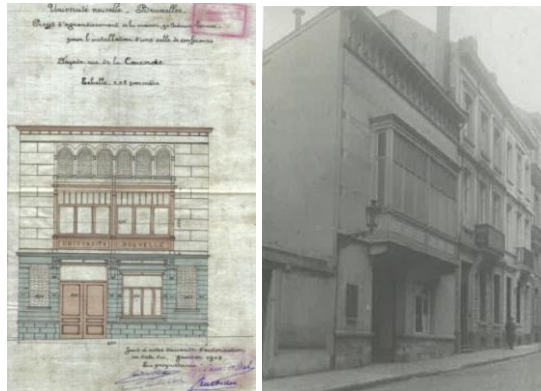
A gauche, élévation de la façade © AVB TP 13930 (permis de bâtir 1908). A droite, photo de la façade, s.d. © Archives ULB