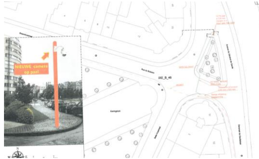
Uittreksel uit de aanvraag