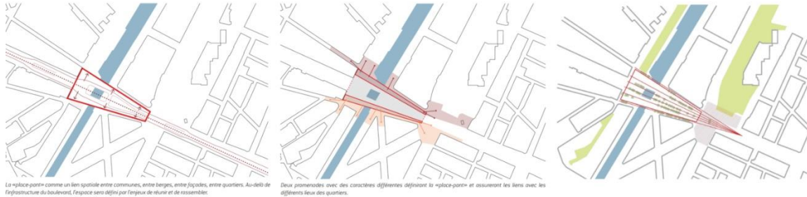
Schéma des trois grands axes du projet – document extr. du dossier de demande