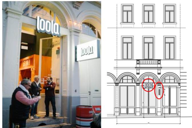
Situation existante (extraits du dossier)