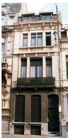
Chaussée de Charleroi 205, 1998

En façade à rue, il n'est pas clair s'il est prévu ou non de remplacer les châssis. Le cas échéant, la CRMS recommande d'opter pour des châssis bois, à profil mouluré en harmonie avec l'architecture éclectique de la maison.