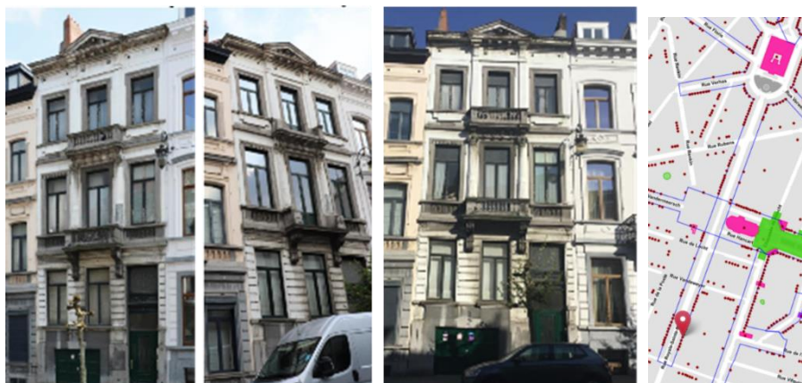
Façade à rue : état antérieur, état existant et photomontage de la situation projetée (documents joints à la demande)