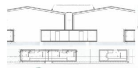
Projet – documents extr. du dossier de demande