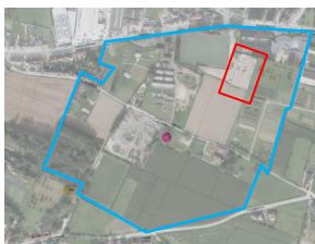
Luizenmolen et sa zone de protection ; en rouge le terrain concerné

Le terrain concerné par la demande est situé dans la zone de protection du monument classé du Luizenmolen. En outre, il est compris dans une zone agricole au PRAS et fait partie du maillage vert et bleu du PRDD.