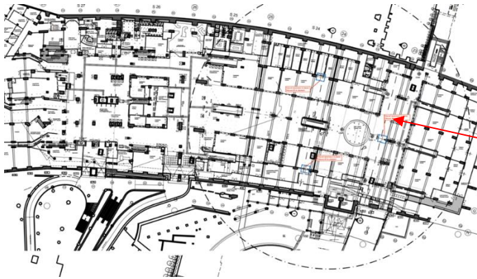
Inplanting nieuwe liften – uittreksel uit het aanvraagdossier

een glazen liftdeur. Een signalisatie moet de liften kenbaar maken en er wordt een blinde geleiding in de vloer voorzien.