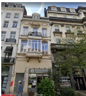
Façade avant.