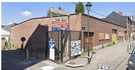
Bestaande toestand – Google Earth