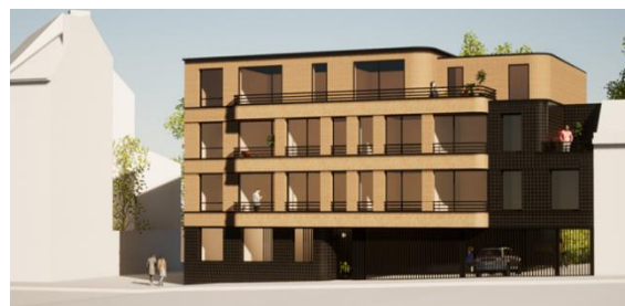
Ontwerp – document uit het aanvraagdossier