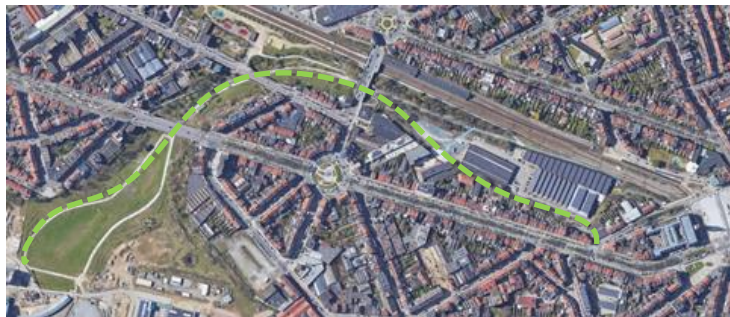
Doorgang naast het perceel van de aanvraag naar Mondia-site en mogelijke verbinding met het bestaande parksysteem