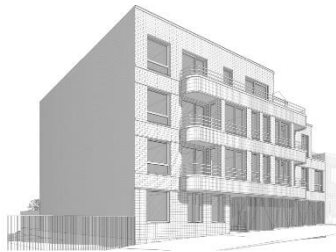
Axonometrie met blinde zijgevel aan linkerzijde – uit het aanvraagdossier

Deze aanvraag legt geen link naar de toekomstige ontwikkeling van de achterliggende industrieterreinen. In haar vorige adviezen wees de KCML er op dat zich aan de linkerzijde van het geplande gebouw een doorgang bevindt naar de Mondia-site, een site die op zijn beurt in verbinding staat met het parksysteem van achtereenvolgens het Pannenhuispark, het park 'Lijn 28' en het park van Thurn & Taxis. De KCML hoopt dat die doorgang naast de projectsite in de nabije toekomst daadwerkelijk het statuut kan krijgen van publieke doorgang naar het achterliggende 'parksysteem'. Indien dat bevestigd kan worden, acht ze het opportuun om het huidige ontwerp op het statuut van die doorgang af te stemmen. Ze vraagt in dat geval de gemene muur - in het huidige ontwerp een blinde muur zonder meerwaarde die erg zichtbaar is in het stadsbeeld - een gepaste architecturale vormgeving te geven zodat deze zijde van het gebouw en de zichten op die gevel aan kwaliteit winnen. De KCML vraagt tot slot de raamkozijnen uit te voeren in een kwaliteitsvol en duurzaam materiaal (niet gepreciseerd in het dossier) en raadt in elk geval het gebruik van PVC-ramen in dat opzicht af.