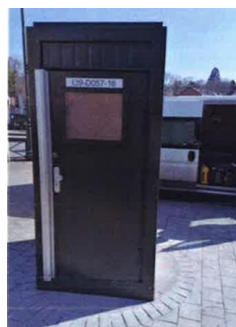
Modèle de la nouvelle sanisette provisoire. Image tirée du dossier

La demande vise le placement d'une sanisette provisoire pour une durée limitée à 3 ans, le temps de la réalisation et de la mise en exploitation d'un nouveau terminus pour la ligne de bus 63 à Gulledele. Dès la mise en exploitation de cette ligne de bus, la STIB s'engage à enlever le sanitaire provisoire. La sanisette sera de couleur vert foncé et implantée à la place de la sanisette actuelle, une colonnette Morris du fabricant JCDecaux placée dans les années '90, obsolète et irréparable.