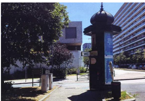
Sanisette actuelle.