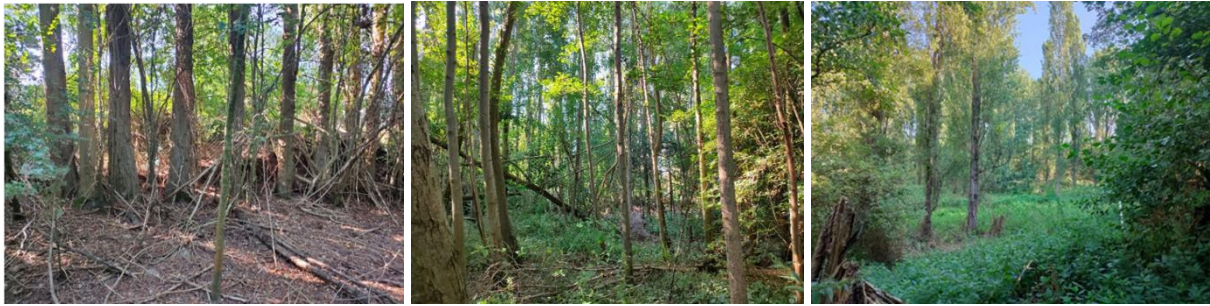
A g. : vue des troncs et collets des peupliers - Au centre : jeune aulnaie au Nord de l'alignement - à dr. : peupliers noirs se développant ponctuellement dans la zone naturelle au Nord (extr. du rapport phytosanitaire accompagnant la demande)