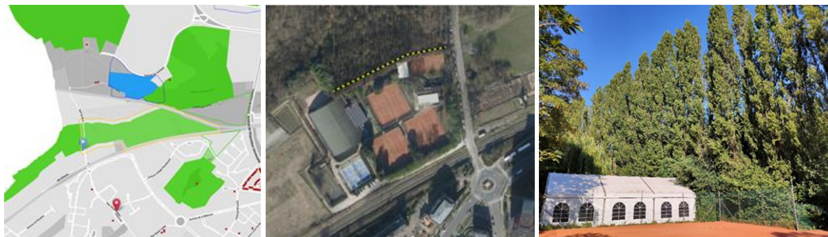
Contexte patrimonial, vue aérienne avec l'implantation de l'alignement d'arbres (extr. du rapport phytosanitaire accompagnant la demande) et vue actuelle des peupliers (extr. du dossier de demande)

L'alignement de 93 peupliers d'Italie concerné par la demande d'abattage se situe partiellement dans la zone de protection du site classé des « prairies marécageuses de Ganshoren » et en bordure du site classé du « vallon du Molenbeek de Ganshoren ». Il est voisin d'une zone Natura 2000, à savoir les « zones boisées et zones humides de la vallée du Molenbeek dans le nord-ouest de la Région bruxelloise ». Le site est repris dans une zone de développement du réseau écologique bruxellois, qui contribue à assurer le maintien ou le rétablissement dans un état de conservation favorable des espèces et habitats naturels.