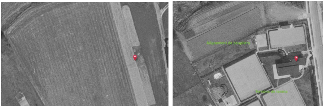
Vues aériennes de 1971 et de 1977

La CRMS émet un avis favorable à l'abattage des peupliers, en précisant que la valeur historique de cet alignement est faible et que l'implantation d'une lisière arbustive rejoint les considérations patrimoniales. L'Assemblée approuve les conclusions du rapport phytosanitaires et les conditions émises en commission de concertation. Elle précise qu'au niveau des espèces à replanter, les recommandations de Bruxelles Environnement en la matière doivent être suivies, en évitant les espèces exotiques envahissantes.