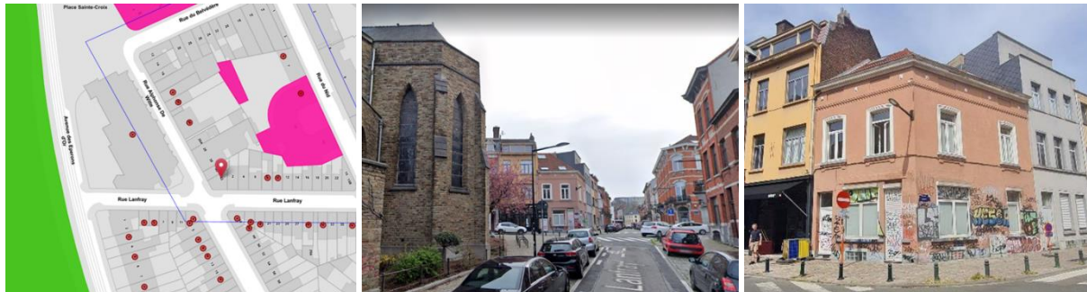
Contexte patrimonial (©Brugis), vue depuis la rue Lanfray (©Google maps) et vue de la maison n°42, rue A. De Witte (extr. du dossier de demande)

En réponse à votre courrier du 02/12/2022, reçu le 05/12/2022, nous vous communiquons l'avis émis par la CRMS en sa séance du 14/12/2022, concernant la demande sous rubrique.