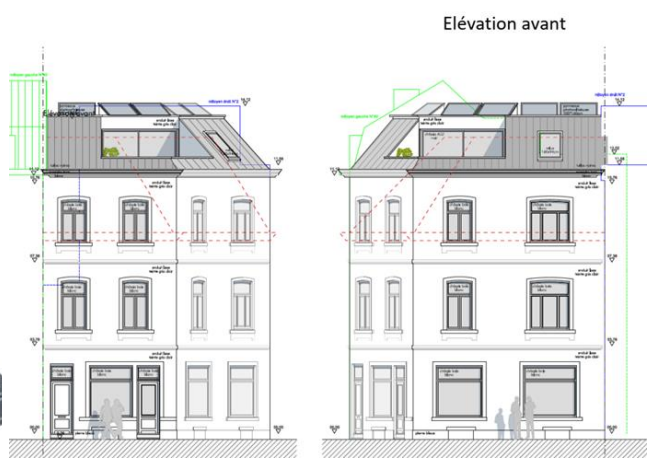
Situation existante et élévations projetées (extr. du dossier de demande)