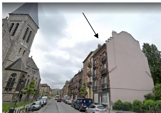
Localisation de l'immeuble en face de l'église classée

Le projet n'aura pas d'incidences patrimoniales négatives sur l'église classée située en face, pour autant que les caractéristiques architecturales de la façade à rue soient préservées. Les menuiseries en façade avant doivent conserver leur couleur blanche et leurs divisions traditionnelles et la corniche doit être conservée et restaurée.