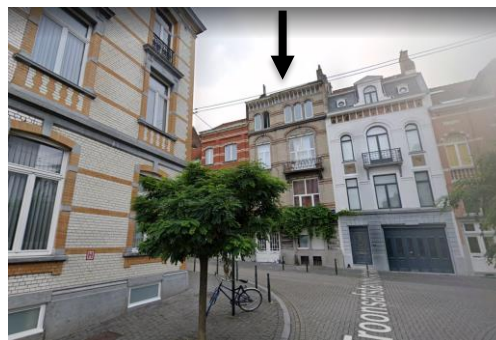
Implantation du projet

La CRMS est défavorable à la mise en conformité des châssis en PVC de la façade avant, dont ni le matériau, ni les divisions sont en phase avec l'intérêt architectural du bien et de son contexte patrimonial. La Commission demande d'améliorer le projet sur ce point afin de préserver les perspectives vers et depuis le bien classé situé à proximité.