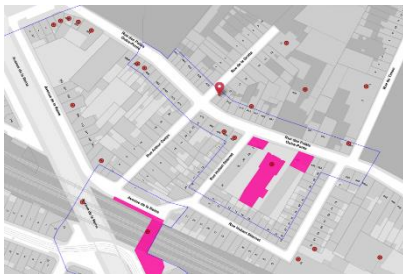
Implantation du projet

En réponse à votre courrier du 03/01/2023, reçu le 04/03/2023, nous vous communiquons l'avis émis par la CRMS en sa séance du 11/01/2023, concernant la demande sous rubrique.