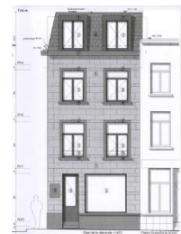
Façade à rue : état existant et projeté (© Streetview et plan joint à la demande)

La CRMS encourage la rénovation de la maison. Tel que proposé, le projet aurait cependant un impact patrimonial négatif sur les perspectives vers la maison communale classée en raison des modifications de la toiture et du surdimensionnement des lucarnes. La Commission demande d'adapter ces éléments à la typologie néoclassique du front bâti et de respecter le principe de la dégressivité des baies. Les menuiseries doivent être de teinte claire.