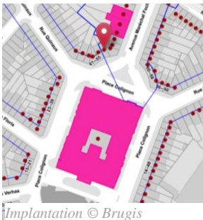
Implantation © Brugis

En réponse à votre courrier du 21/12/2022, nous vous communiquons l'avis émis par la CRMS en sa séance du 11/01/2023, concernant la demande sous rubrique.