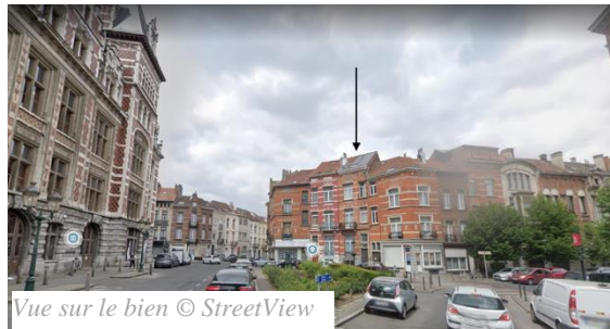
Vue sur le bien

Les travaux de rénovation intérieure consignés dans la demande de régularisation n'appellent pas de remarques d'ordre patrimonial.