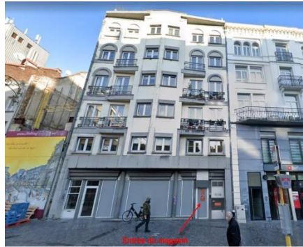
Immeuble concerné par la demande et état projeté du rez-de-chaussée (documents joints à la demande)