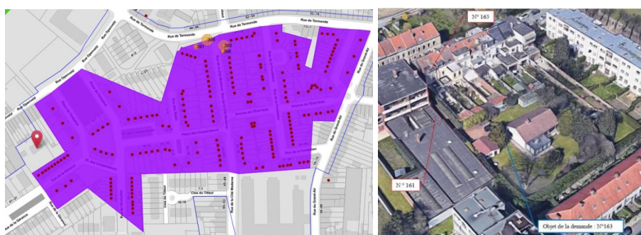
Implantation du bien (© Brugis) et photo aérienne jointe à la demande

En réponse à votre courrier du 10/01/2023, reçu le 16/01/2023, nous vous communiquons l'avis émis par la CRMS en sa séance du 01/02/2023, concernant la demande sous rubrique.