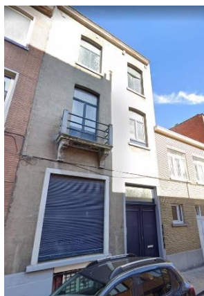
Implantation du bien s façade à rue (photo jointe à la demande)

Le dossier concerne la maison sise 46, rue Hubert Stiernet, dont la partie arrière est comprise dans la zone de protection de la première maison communale de Laeken