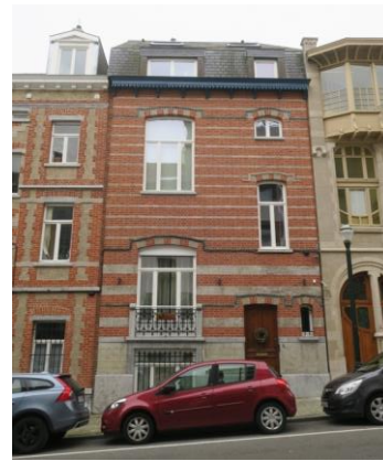
Façade Rue du Lac.

Le bien est compris dans la zone de protection de l'Ancien atelier et habitation du maître verrier Clas Grüner Sterner, et de la maison Art Nouveau sise Rue de la Vallée 40. Il est aussi inscrit à Inventaire du patrimoine architectural.