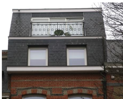
Terrasse en toiture Rue de la Vallée.