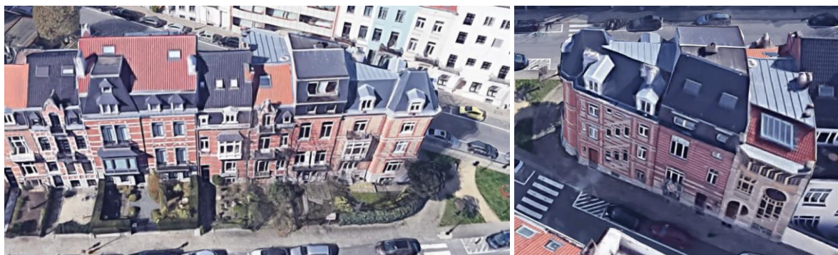
Vue de l'enfilade Rue de la Vallée et Rue du Lac.

En préalable, la CRMS insiste sur la remarquable unité de composition des façades conservées de cet ensemble/alignement, et ce, des deux côtés.