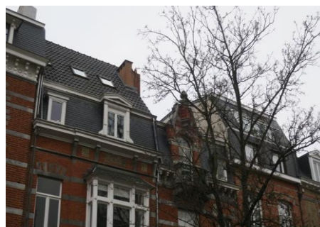
Photo des toitures de l'enfilade Rue de la Vallée.

Donc tant pour l'immeuble, que pour la zone de protection, la CRMS pas favorable à la modification proposée pour le triplet, ni aux régularisations pour le terrasson et la corniche.