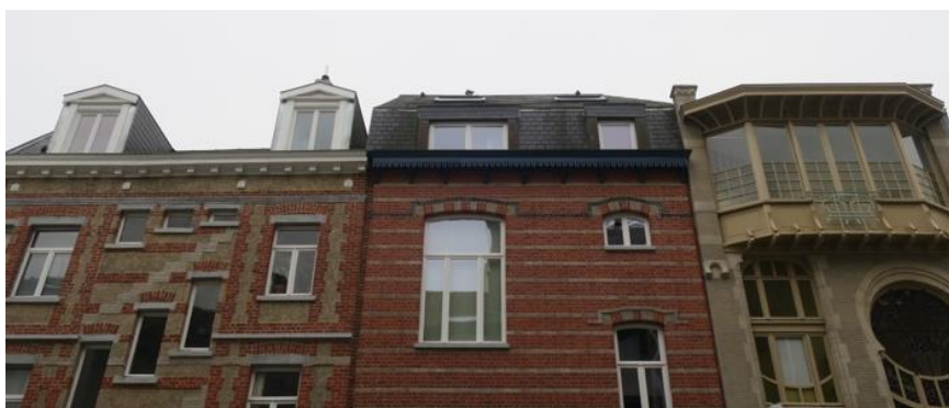
Photo des toitures de l'enfilade Rue du Lac.

Les interventions réalisées dans le terrasson de toiture, sont également peu qualitatives et altèrent le bien et l'alignement. La CRMS demande, de ce côté-là également, le rétablissement des lucarnes disparues et de leurs détails d'origine.