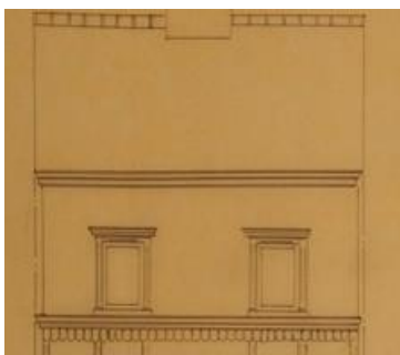
Toiture Rue de la Vallée. Archive de 1891.

Les interventions réalisées dans le terrasson de toiture et au niveau de la corniche, sont également peu qualitatives et altèrent la cohérence d'ensemble formé par les trois bâtiments contigus de Delune, et plus largement de l'alignement. Il faut à cet endroit, préserver un contexte urbain de grande qualité pour la maison Art nouveau voisine, classée et récemment restaurée. Il s'agit de sa zone de protection.