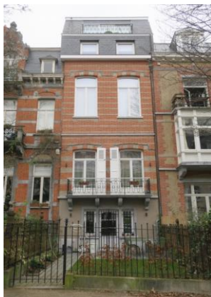
Façade Rue de la Vallée. 2023