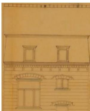
Toiture Rue du Lac. Archive de 1891.