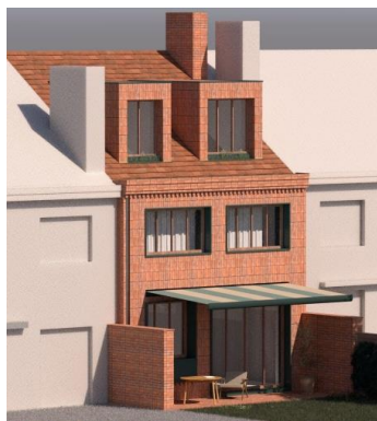
Montage 3D de la situation projetée.