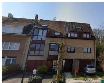
Implantation du bien (© Brugis) et état existant de la façade à rue (photo jointe à la demande)

La demande concerne la maison située 71 avenue du Directoire, comprise dans la zone de protection du site classé du Kauwberg . Elle vise l'ajout de deux lucarnes en versant arrière de la toiture, l'isolation de la façade arrière et de la toiture ainsi que le placement d'une seconde fenêtre de toit en toiture avant.