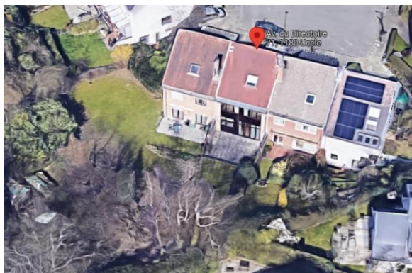
Vue aérienne de la façade arrière

La demande concerne la maison située 71 avenue du Directoire, comprise dans la zone de protection du site classé du Kauwberg . Elle vise l'ajout de deux lucarnes en versant arrière de la toiture, l'isolation de la façade arrière et de la toiture ainsi que le placement d'une seconde fenêtre de toit en toiture avant.