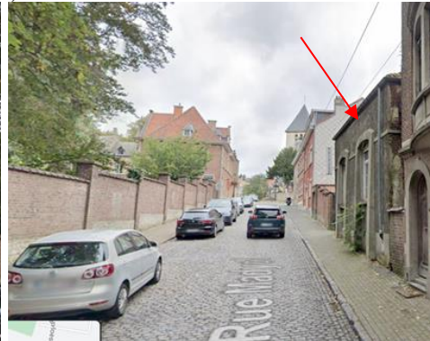
Vue de l'ancienne école dans la rue Madyol

La demande initiée par le Collège des Bourgmestre et Echevins porte sur le classement comme monument de cette ancienne école.