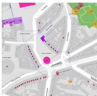
Localisation du bien

En réponse à votre courrier du 02/02/2023, nous vous communiquons l'avis émis par la CRMS en sa séance du 15/02/2023, concernant la demande sous rubrique.