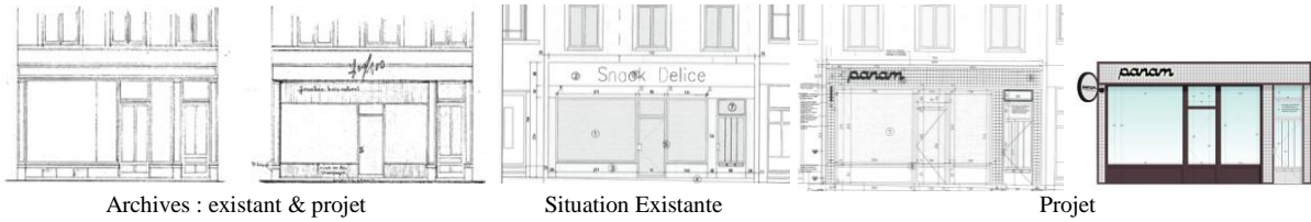
Dessins extraits du dossier