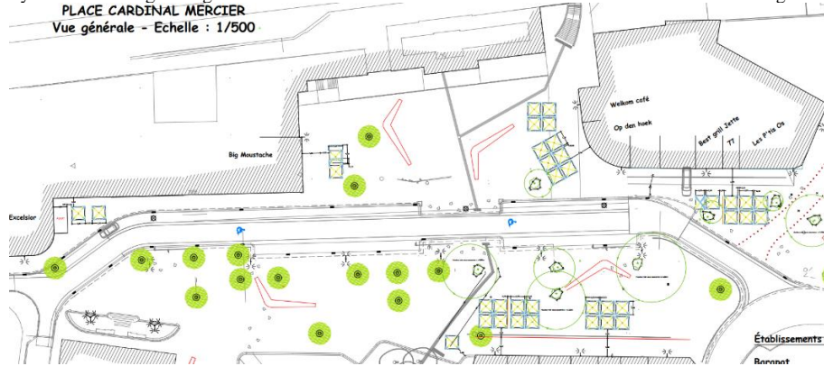
Localisation des ancrages sur la Place Cardinal Mercier. Image tirée du dossier.