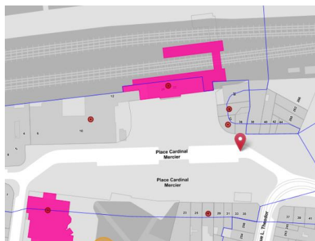
Place Cardinal Mercier

La Place Cardinal Mercier est comprise dans les zones de protection de la gare de Jette et de l'ancien Hôtel Communal de Jette, classés comme monument. Le présent avis de la CRMS ne porte que sur celle-ci, et pas sur les Places Laneau et Reine Astrid, pour lesquelles aucune disposition du CoBAT ne le requiert.