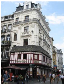
Toestand van de gevels in 2019

In antwoord op uw brief van 08/03/2023, sturen wij u het advies dat onze Commissie over bovengenoemd onderwerp uitgebracht heeft tijdens haar vergadering van 29/03/2023.