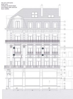
Bestaande rechtstoestand (vergunning afgeleverd in 2020)