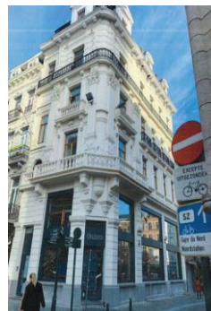
Staat van het gebouw in 2023