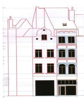
Situation de fait Image tirée du dossier de demande

La CRMS estime que la demande de changement de destination relève surtout d'un examen urbanistique. La couverture de la cour n'appelle pas de remarques d'ordre patrimonial. Sur les interventions en façade avant, la CRMS demande de se conformer aux prescriptions du RCUZ 'Grand-place'.