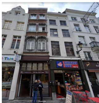
Vue de l'immeuble

En réponse à votre courrier du 13/03/2023, nous vous communiquons l'avis émis par la CRMS en sa séance du 29/03/2023, concernant la demande sous rubrique.