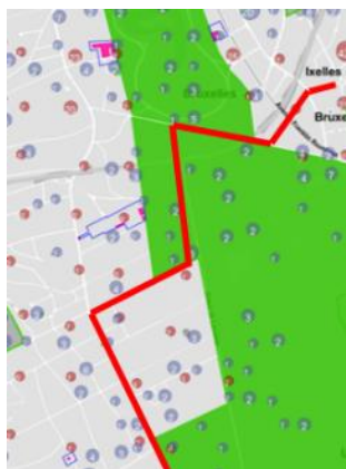
Tracé général de la fibre optique sur fond de plan Brugsis© des biens protégés