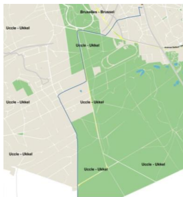
Tracé général de la fibre optique en Région bruxelloise. (image extraite du dossier)

En réponse à votre courrier du 17/03/2023, reçu le 20/03/2023, nous vous communiquons l'avis conforme favorable sous conditions émis par notre Assemblée en sa séance du 29/03/2023.