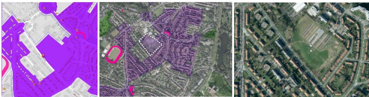
Contexte patrimonial du terrain et situation existante (2021)

La demande vise la régularisation d'un ensemble de dispositifs accessoires à l'agriculture urbaine, installés sans autorisation préalable sur le champ des Cailles à Watermael-Boitsfort.