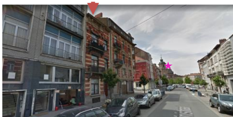
Implantation du bien, face à la Maison communale classée