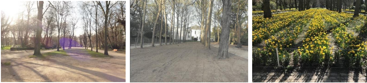
Vues de l'allée « Horta » avant travaux, en automne 2022 et au printemps 2023

La demande vise le remaniement de l'allée Horta composée d'une quadruple rangée d'arbres bordant deux chemins ainsi qu'une pelouse centrale. Le projet a pour but de concentrer le public sur les chemins, de diminuer le piétinement au pied des arbres et de décompacter le sol à leur pied. La mise en défens des arbres est réalisée sous forme d'une zone plantée de bulbeuses à floraison étalée. À terme, ce principe de mise en défens pourrait s'étendre à différents endroits du site. Cette opération est donc considérée par le demandeur comme une phase test préliminaire à la restauration globale du parc. Elle servira à élaborer des fiches de recommandation ainsi qu'un cahier des charges type, à intégrer au dossier de restauration globale qui est actuellement au stade de l'avant-projet.