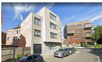
Immeuble concerné par la demande, façade donnant sur la rue de l'Escaut