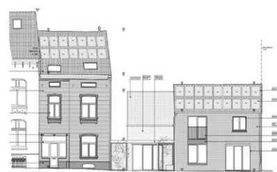
Élévation projetée. Image tirée di dossier.

L'emprise du projet est comprise dans la zone de protection du Parc de Roodebeek.