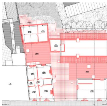
Implantation projetée. Image tirée du dossier.