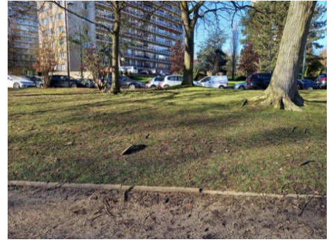
Ex. d'un agrès (le n°9 du plan d'implantation) – images extr. du dossier de demande